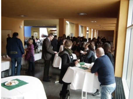
Kaffeepause mit Möglichkeit zum fachlichen Austausch